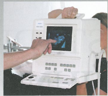
Fabas skylningsgruppe og ET-dyrlægenes faglige kompetence er en stor del af forklaringen på de gode ET-resultater i Finland.

Der er søgt alle mulige spekulationer om årsagerne til de gode finske ET-resultater, men der er næppe blot én afgørende forklaring. Kombinationen af ejernes pasning af dyrene, gode hundyr, Fabas dygtige skylningsgruppe og ET-dyrlægenes faglige kompetence er sikkert en stor del af forklaringen. Resultaterne er også meget pålidelige eftersom alle skylninger og ilægninger sker ifølge myndighedernes forskrifter. ●